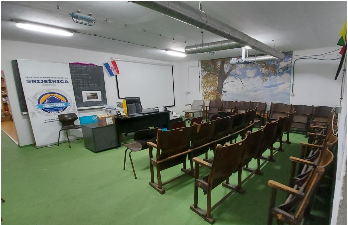
Slika broj 2