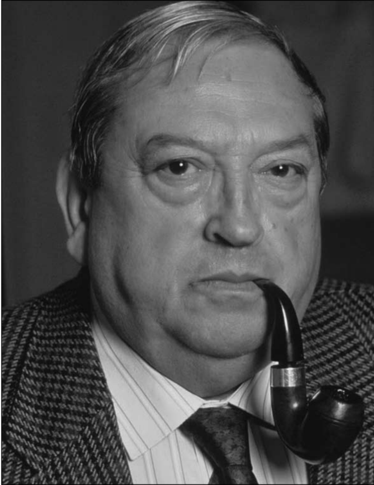
Jacques Le Goff