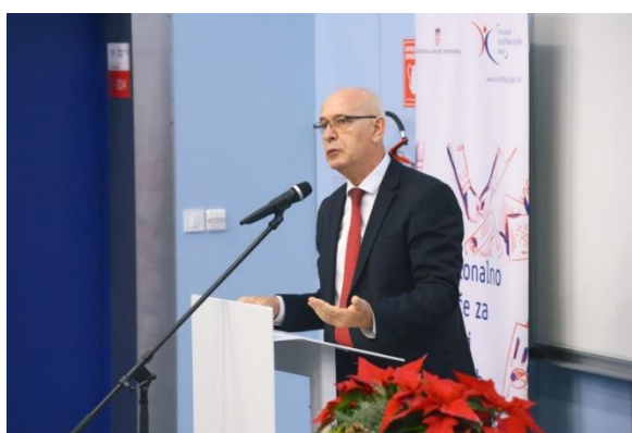
Paralelna cjelina: Kurikularna reforma u strukovnom obrazovanju i osposobljavanju

Nacionalna razvojna strategija do 2030. godine potaknula je raspravu o učinkovitosti formiranja i promišljanja dugoročnih strateških ciljeva Hrvatske te o dosadašnjem napretku u izradi ovog dokumenta iz perspektive članova tematskih radnih skupina. Promišljanje sustava priznavanja i vrednovanja prethodnog učenja vodilo se iz perspektive potreba razvoja takvog sustava u obrazovanju odraslih, na nacionalnoj razini, te u visokom obrazovanju, iz perspektive zadaća, mogućnosti spremnosti visokih učilišta.