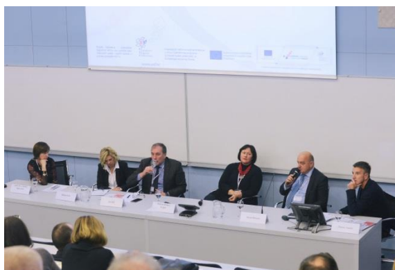
Panel rasprava: Nacionalna razvojna strategija Republike Hrvatske do 2030. godine