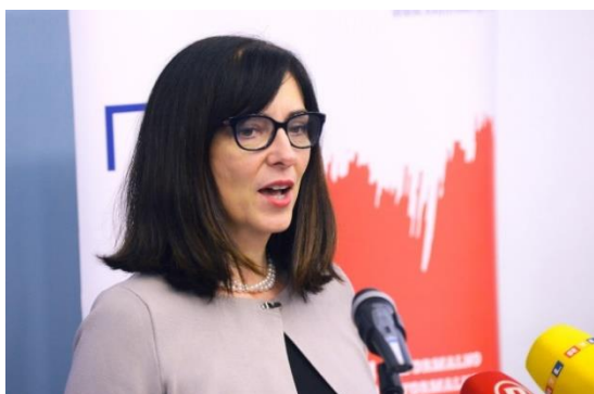
prof. dr. sc. Blaženka Divjak, ministrica znanosti i obrazovanja