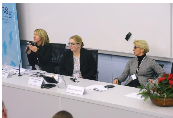
Paralelna cjelina: Unaprjeđenje i verifikacija ishoda učenja u visokom obrazovanju