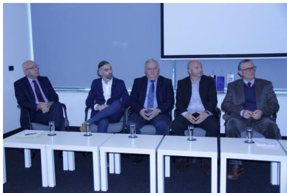
Panelisti Okruglog stola Poduzetnik – jedan od ključnih čimbenika razvoja strukovnog obrazovanja