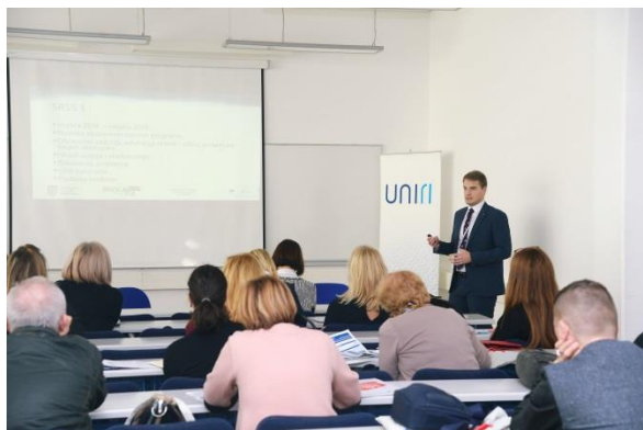
Paralelna cjelina: Kurikularna reforma – alat za unaprjeđenje relevantnosti i kvalitete