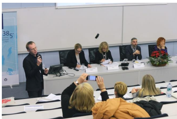
Panel rasprava: Priznavanje i vrednovanje prethodnog učenja

Nacionalna razvojna strategija do 2030. godine potaknula je raspravu o učinkovitosti formiranja i promišljanja dugoročnih strateških ciljeva Hrvatske te o dosadašnjem napretku u izradi ovog dokumenta iz perspektive članova tematskih radnih skupina. Promišljanje sustava priznavanja i vrednovanja prethodnog učenja vodilo se iz perspektive potreba razvoja takvog sustava u obrazovanju odraslih, na nacionalnoj razini, te u visokom obrazovanju, iz perspektive zadaća, mogućnosti spremnosti visokih učilišta.