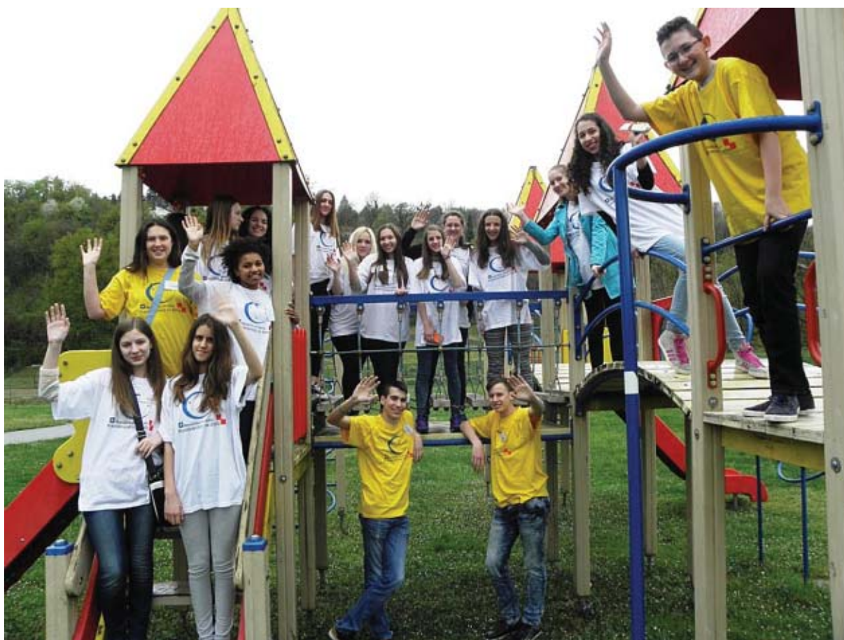
Mreža mladih savjetnika pravobraniteljice za djecu - MMS