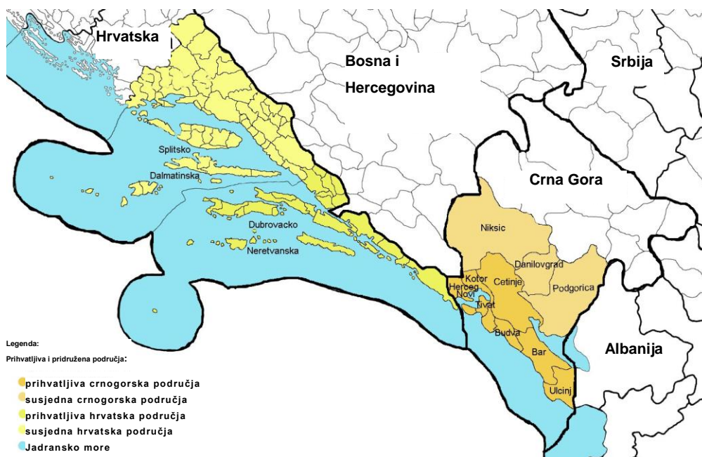
Karta 1: Prihvatljiva i pridružena područja za Hrvatsku i Crnu Goru