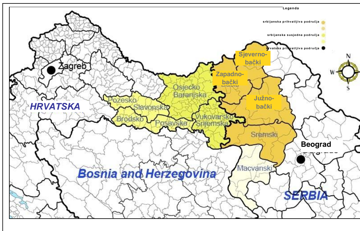
Slika 1 Programsko područje

Povrh toga, programsko se područje proteže na 2 hrvatske županije i 1 srbijanski susjedni okrug (vidjeti tablicu iznad). Razlog primjene programa na ova dodatna područja su njihove velike sličnosti sa prihvatljivim područjima u smislu demografskih, gospodarskih i geografskih obilježja. Veze između prihvatljivih i susjednih regija osobito su naglašene vezano uz tradiciju i kulturu, a razlog tome su velike migracije sredinom 1990-ih, nakon rata.