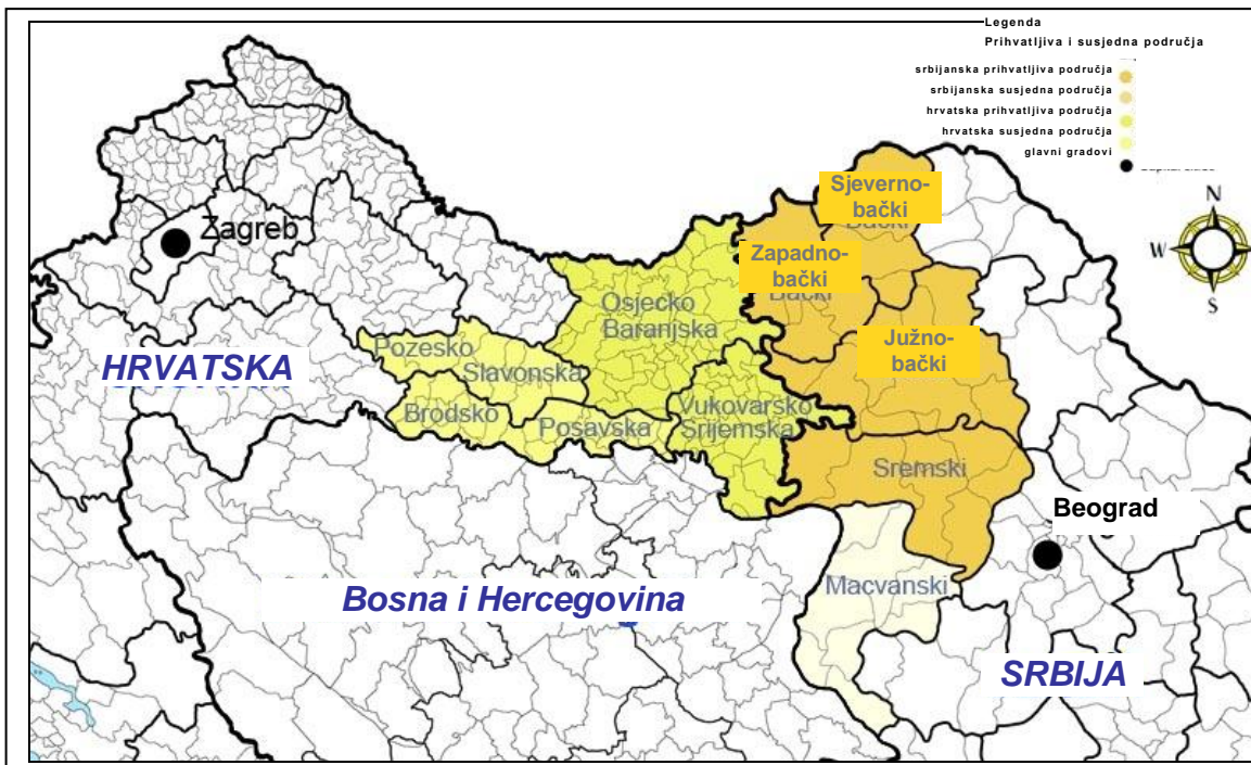
Slika 1 Programsko područje

Povrh toga, programsko se područje proteže na 2 hrvatske županije i 1 srbijanski susjedni okrug (vidjeti tablicu iznad). Razlog primjene programa na ova dodatna područja su njihove velike sličnosti sa prihvatljivim područjima u smislu demografskih, gospodarskih i geografskih obilježja. Veze između prihvatljivih i susjednih regija osobito su naglašene vezano uz tradiciju i kulturu, a razlog tome su velike migracije sredinom 1990-ih, nakon rata.