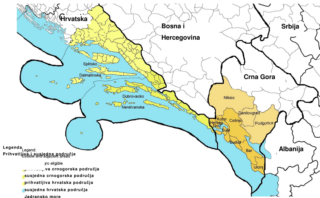
Mapa 1: Prihvatljiva i susjedna područja za Hrvatsku i Crnu Goru