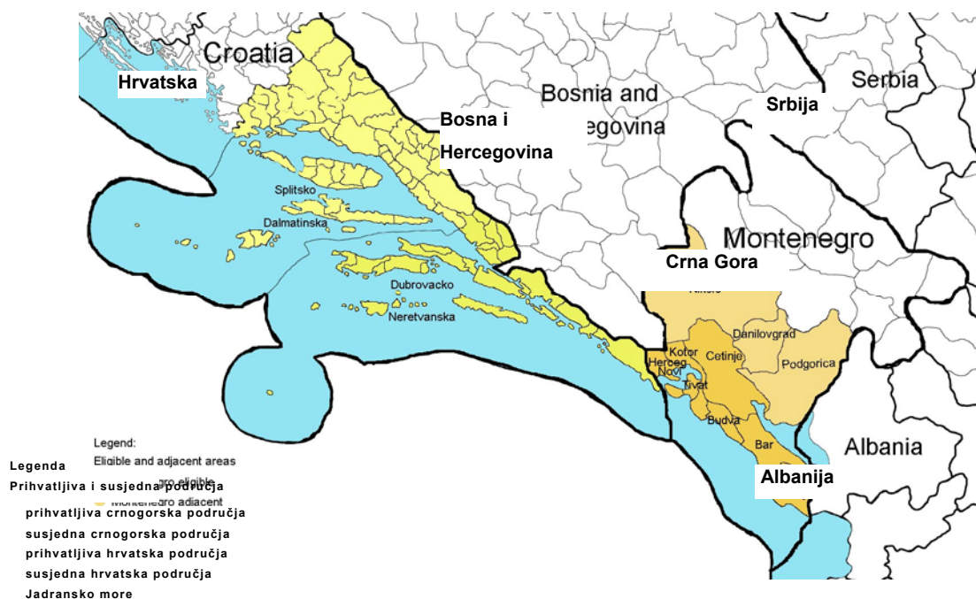
Mapa 1: Pribvatljiva i susjedna područja za Hrvatsku i Crnu Goru