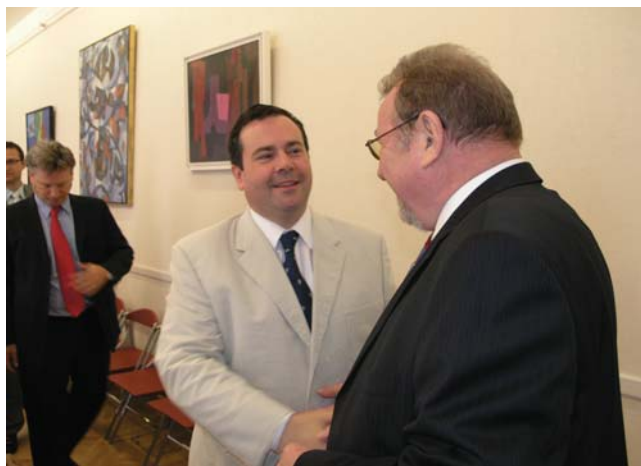
Potpredsjednik Sabora Šeks primio državnog tajnika Kanade Kenneya

Jason Kenney naglasio je da odnosi dviju zemalja vidno napreduju i intenziviraju se na mnogim područjima. „Cijenimo put kojim Hrvatska ide i napredak koji je postigla, pa i ne čudi da upravo Hrvatska postaje lider čitave regije”,