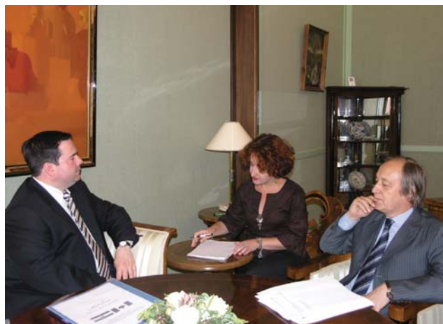
Furio Radin sastao se sa državnim tajnikom za multikulturalizam i kanadski identitet Kenneyem

Državni tajnik Jason Kenney izložio je aktualno stanje u Kanadi s obzirom na useljeničku politiku, a razgovaralo se i o poduzimanju konkretnih mjera kako bi se useljeničko stanovništvo uspješno integriralo u kanadsko društvo. U nastavku je bilo riječi i o zastupljenosti autohtonih nacio-