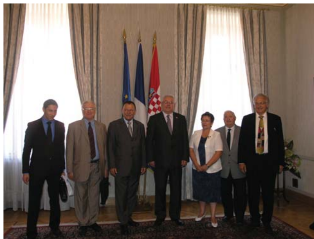
Predsjednik Hrvatskog sabora Luka Bebić i izaslanstvo Senata Francuske Republike

Senator Sido je izrazio zadovoljstvo tijekom hrvatskih pregovora o pristupanju Europskoj uniji, te je iznio čvr-