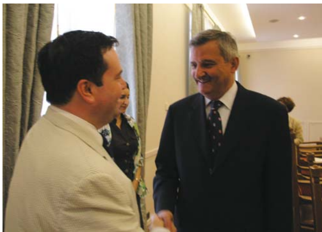
Mario Zubović i kanadski državni tajnik Kenney

(Zagreb, 8. srpnja 2008.) Na sastanku se razgovaralo o procesu decentralizacije u Republici Hrvatskoj. Zvonimir Mršić istaknuo je donošenje Zakona o lokalnoj i regionalnoj samoupravi 2005. godine kao važan korak u postupnoj decentralizaciji Hrvatske. Naglasio je važnost usklađivanja i drugih zakona koji se odnose na jedinice lokalne samouprave sa Zakonom o lokalnoj i regionalnoj samoupravi. Zvonimir Mršić izvjestio je gosta i o problemima s kojima se suočava kao gradonačelnik Koprivnice, a koji se odnose prije svega na preraspodjelu financijskih sredstava iz Državnoga proračuna za jedinice lokalne samouprave. Razgovaralo se još i o aktivnom sudjelovanju jedinica lokalne samouprave pri dobivanju