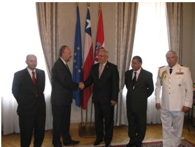
Predsjednik Sabora sa zamjenikom predsjednika Senata Republike Čile Baldom Prokuricom

U razgovoru sa članovima izaslanstva čileanskog Senata predsjednik Sabora je istaknuo kako Hrvatska pruža velike potencijale za tješnju gospodarsku suradnju s obzirom na to da njezin geografski položaj omogućuje dobru prometnu komunikaciju preko morskih luka Rijeka, Zadar i Ploče, željeznicom i riječnim putem sa srednjom Europom.