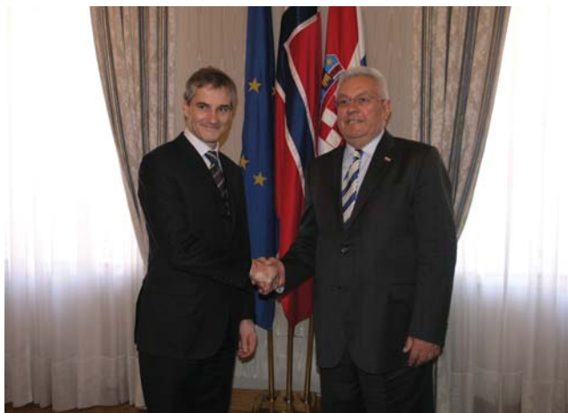
Predsjednik Sabora Luka Bebić sa norveškim ministrom vanjskih poslova

Predsjednik Sabora Luka Bebić je čileansko izaslanstvo informirao o tijeku pregovora Hrvatske s Europskom unijom, kao i o pripremama za ulazak u NATO. Rekao je kako Hrvatska na prilagodbi za članstvo u Europskoj uniji nastavlja raditi nesmanjenom brzinom, bez obzira na trenutačne teškoće u samoj Uniji koje su nastale irskim odbijanjem Lisabonskog ugovora.