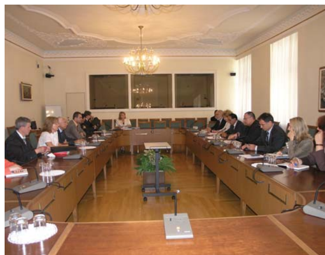
Šime Lučin i Milorad Pupovac sa izaslanstvom Skupštine Republike Kosovo

Središnja tema sastanka bila je razvoj ljudskih i manjinskih prava. Sugovornici su se složili da, iako je potre-