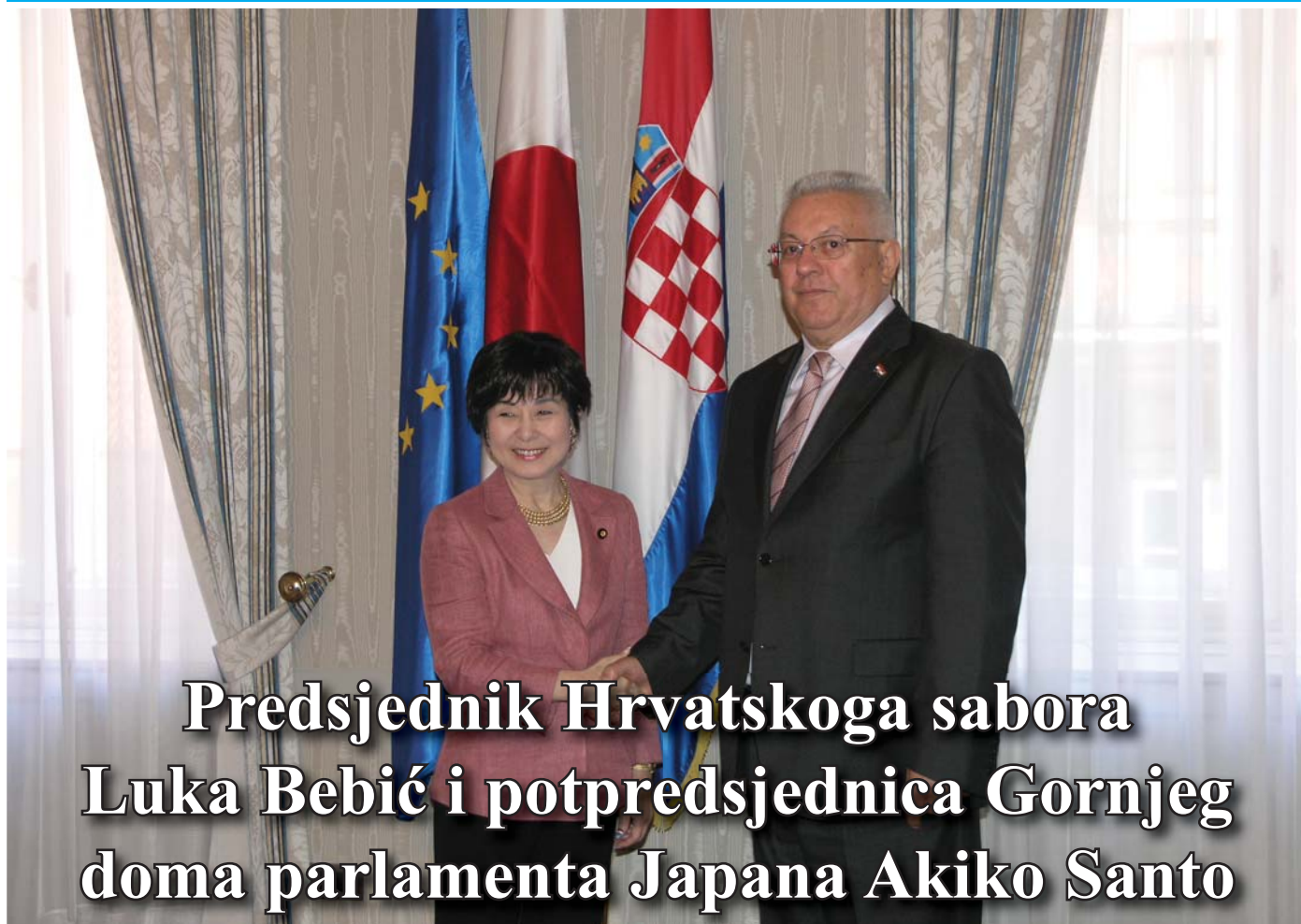
Predsjednik Hrvatskoga sabora Luka Bebić i potpredsjednica Gornjeg doma parlamenta Japana Akiko Santo