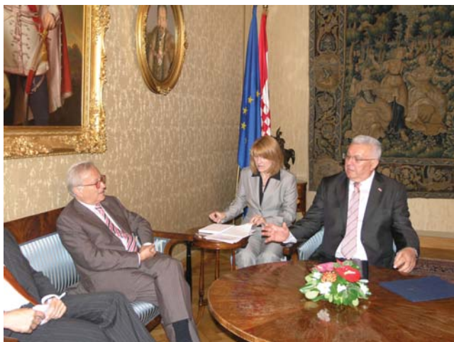
Predsjednik Sabora Luka Bebić susreo se sa izvjestiteljem Europskog parlamenta za Hrvatsku Hannesom Swobodom

ispunio plan prilagodbe europskog zakonodavstva, te je do kraja godine preostala okruglo jedna trećina od planiranih tzv. „europski” zakona koje još treba usvojiti. Potvrdio je da će Hrvatska nastavljati ispunjavati svoje obveze bez obzira na trenutne teškoće u Europskoj uniji oko Lisabonskog ugovora, te je izrazio uvjerenje da će taj problem biti riješen za vrijeme francuskog predsjedanja Europskom unijom.