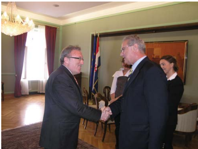
Neven Mimica primio izaslanstvo Odbora za vanjsku politiku Velike nacionalne skupštine Republike Turske

konsenzus o pitanju potpore putu Hrvatske prema EU. Taj konsenzus u konkretnom obliku odražava se u radu dvaju parlamentarnih odbora koji su specijalizirani za pitanja oko EU, a to su Nacionalni odbor i Odbor za europske integra-