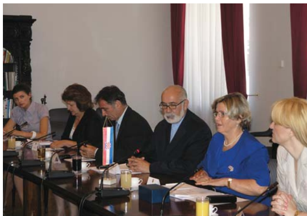
Zastupnici nacionalnih manjina primili izaslanstvo Odbora za prekogranične Čehe iz češkog parlamenta

Zastupnica Čuhnil predstavila je položaj Kluba nacionalnih manjina u Hrvatskome Saboru, sustav izbora zastupnika nacionalnih manjina, a informirala je goste i o broju predstavnika pojedine nacionalne manjine. U nastavku se razgovaralo o sporazumu koji su nacionalne manjine potpisale s Vladom Republike Hrvatske te temeljnim principima i zahtjevima manjina koji su sporazumom definirani. Bilo je riječi i o konkretnim zahtjevima manjina koji se odnose na probleme dvojezičnosti, socijalno-ekonomski razvoj te razvoj institucija nacionalnih manjina.