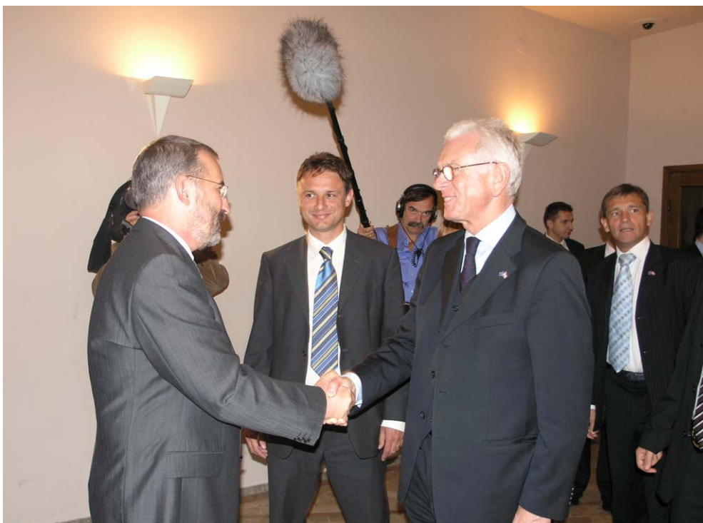
Predsjednik Europskog parlamenta u susretu s dužnosnicima

s dosadašnjim razvojem svojih prava kao i s preostalim problemima s kojima se susreću manjine u Republici Hrvatskoj. Istaknut je dobar zakonodavni okvir i pozitivan trend u osiguravanju i promicanju prava nacionalnih manjina, no zastupnici su podsjetili i na neke od preostalih poteškoća s kojima se susreću u ostvarivanju svojih prava kao što su implementacija zakona na lokalnoj razini, povratak izbjeglica i razvoj povratničkih sredina te dostupnost elektroničkih medija. Razgovaralo se i o vezama nacionalnih manjina sa svojim matičnim državama te na pravo glasa pripadnika nacionalnih manjina koji borave izvan Republike Hrvatske. Predsjednik Europskog parlamenta Hans-Gert Pöttering još jednom je naglasio važnost njegovanja prava nacionalnih manjina te je izrazio nadu da će se sljedeći susret realizirati u okviru Europske unije.