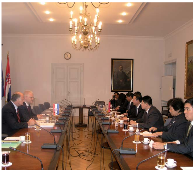
Voditelj Hrvatsko-kineske skupine prijateljstva Ivo Josipović s Izaslanstvom kineske provincije Liaoning

(Zagreb, 25. rujna 2007.) Ivo Josipović istaknuo je dosadašnju suradnju Narodne Republike Kine i Republike Hrvatske kao dobru i prijateljsku, dodavši da, iako vrlo različite zemlje po veličini, dobro surađuju i dijele stajališta oko svih važnijih bilateralnih pitanja. Zahvalio