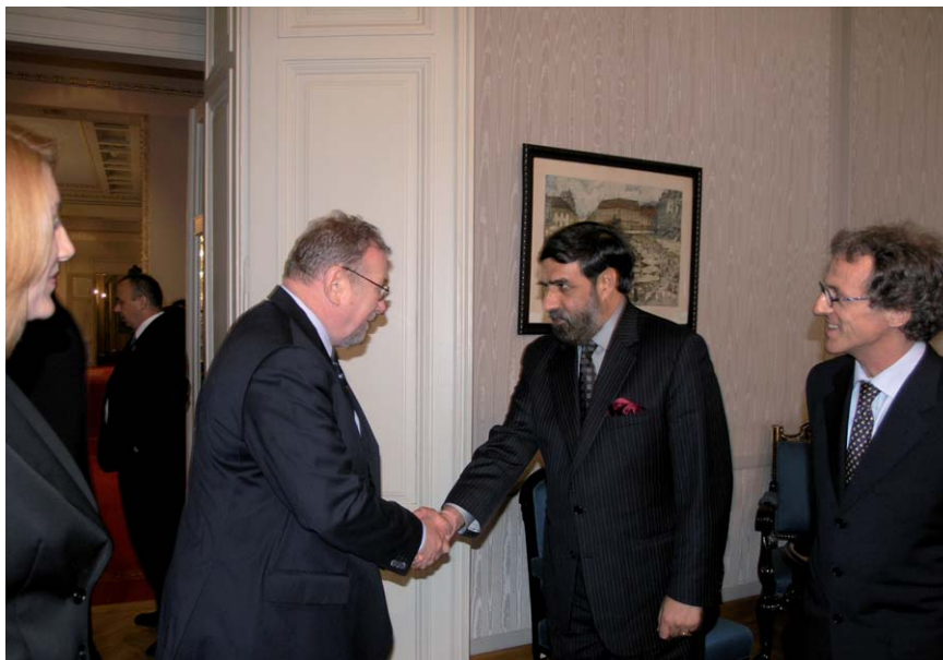
Predsjednik Hrvatskoga sabora Vladimir Šeks prima državnog ministra vanjskih poslova Republike Indije Ananda Sharmu

(Zagreb, 19. rujna 2007.) U razgovoru dvojice dužnosnika izraženo je zadovoljstvo razvojem bilateralnih odnosa koji su tradicionalno prijateljski, stabilni i bez otvorenih pitanja. Hrvatska i Indija dobro surađuju i na multilateralnom planu u okviru međunarodnih organizacija, a od uspostave diplomatske suradnje kontinuirano se odvija i u parlamentarnim okvirima, na razini predsjednika parlamenata, kao i na razinama odbora i parlamentarnih izaslanstava. Predsjednik Hrvatskoga sabora Šeks i indijski državni ministar za vanjske poslove Sharma suglasili su se da nisu iskorišteni svi potencijali za suradnju, prije svega na planu gospodarstva, obrazovanja i znanstvenih istraživanja.