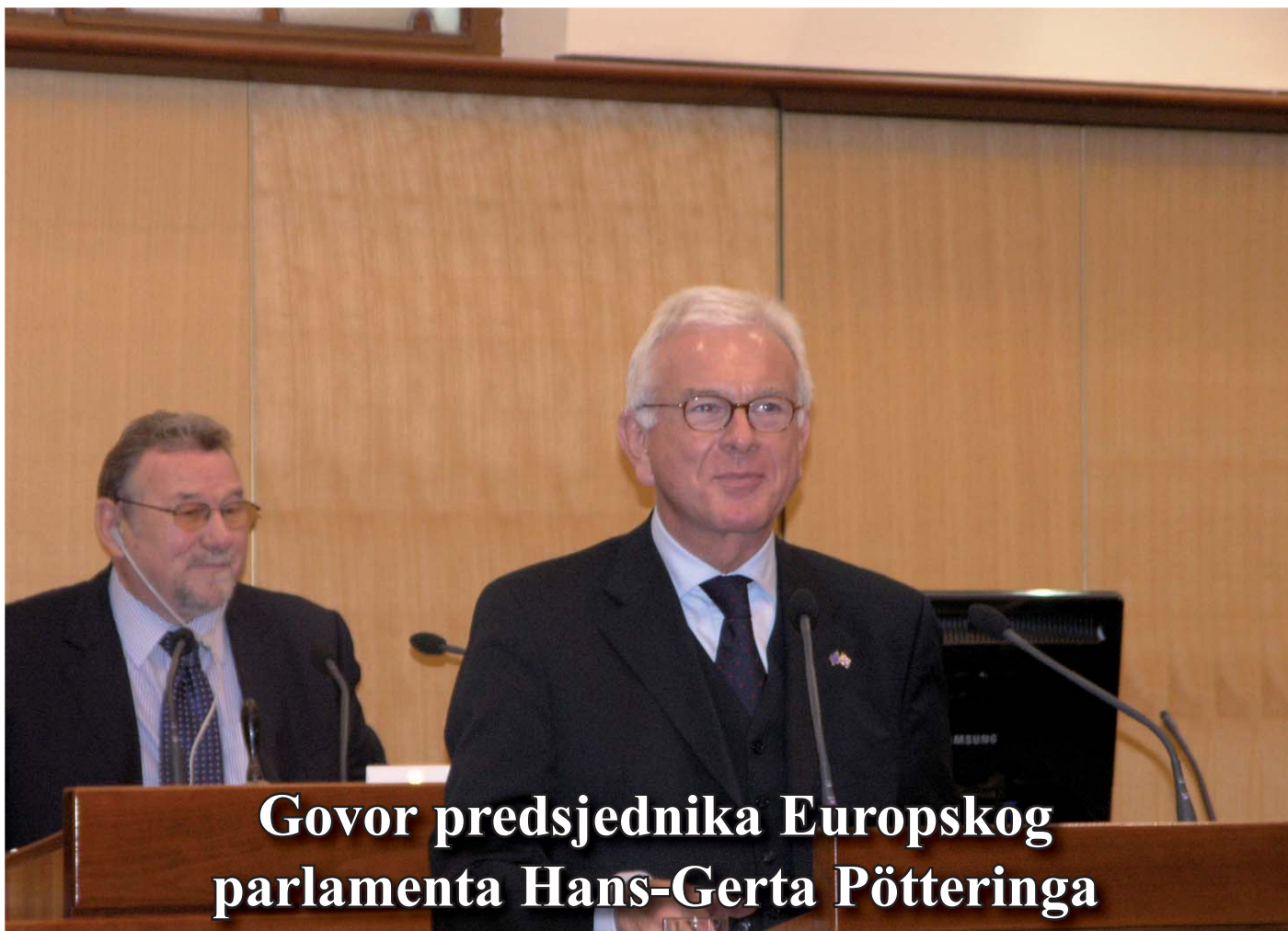
Govor predsjednika Europskog parlamenta Hans-Gerta Pötteringa