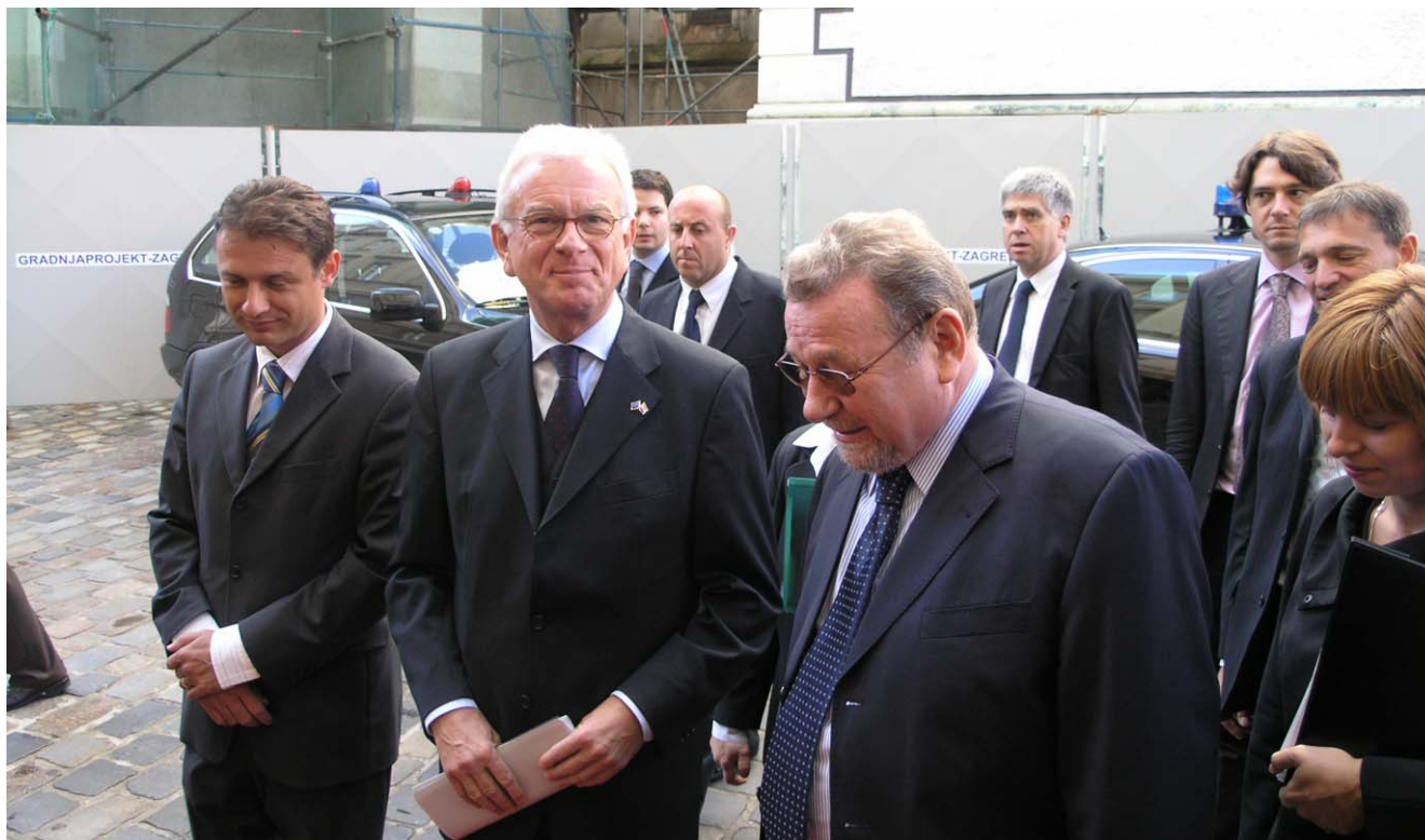
Predsjednik Sabora Vladimir Šeks primio predsjednika Europskog parlamenta Hans-Gerta Pötteringa

Predsjednik Hrvatskog sabora Vladimir Šeks potvrdio je stajalište predsjednika Europskog parlamenta koji je