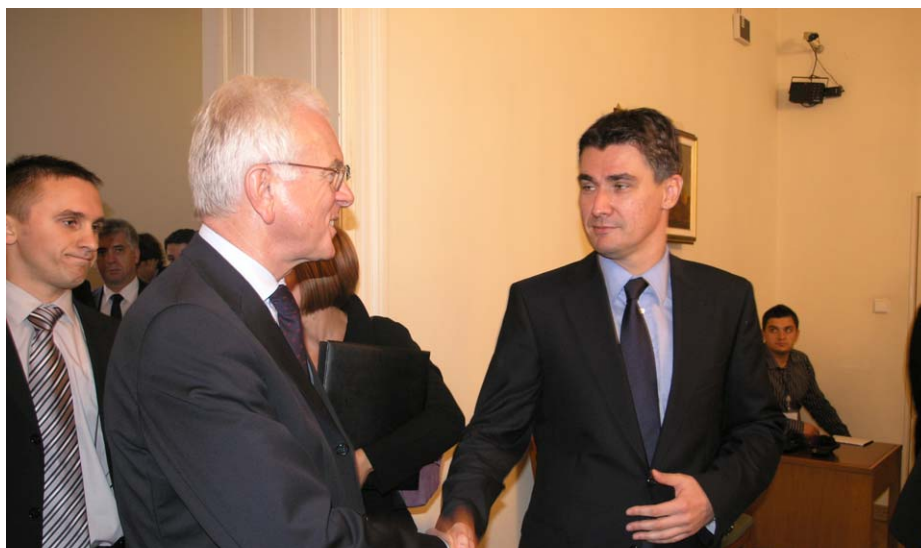
Predsjednik Nacionalnog odbora Zoran Milanović i članovi Odbora primili su u službeni posjet predsjednika Europskog parlamenta Hans-Gerta Pötteringa.

(Zagreb, 28. rujna 2007.) Zoran Milanović upoznao je goste s radom i sastavom Nacionalnoga odbora, rekavši kako je Odbor nadstranačko tijelo jer uključuje, osim predstavnika parlamentarnih stranaka, i predstavnike