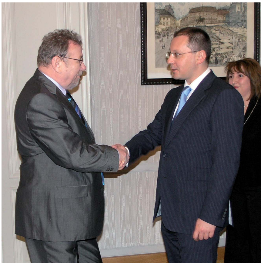
Predsjednik Hrvatskog sabora Vladimir Šeks primio je predsjednika Vlade Republike Bugarske Sergeja Staniševa

(Zagreb, 4. travanj 2007.) U žarištu razgovora bili su Europska unija, NATO, suradnja u regiji i gospodarska razmjena dviju zemalja. Bugarski je premijer Stanišev izrazio uvjerenje kako Hrvatska i Bugarska snose znatnu odgovornost za stabilnost u regiji kao i da bi nova destabilizacija područja jugoistočne Europe nanijela veliku štetu cijeloj regiji, ali