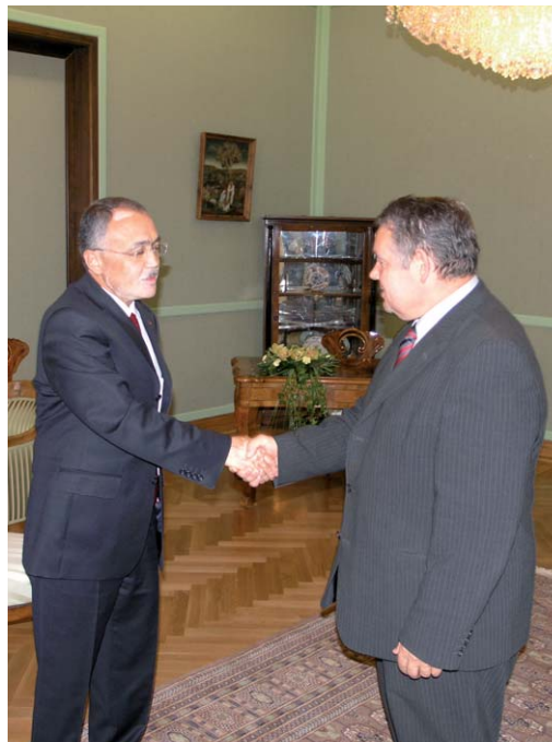
Potpredsjednik Sabora Mato Arlović primio potpredsjednika Velike nacionalne skupštine Republike Turske Sadika Yakuta

Potpredsjednik Velike nacionalne skupštine Republike Turske Sadik Yakut najavio je daljnju potporu Hrvatskoj u procesu pristupanja NATO-u i izrazio uvjerenje da će 2008. biti godina ulaska RH u NATO savez.