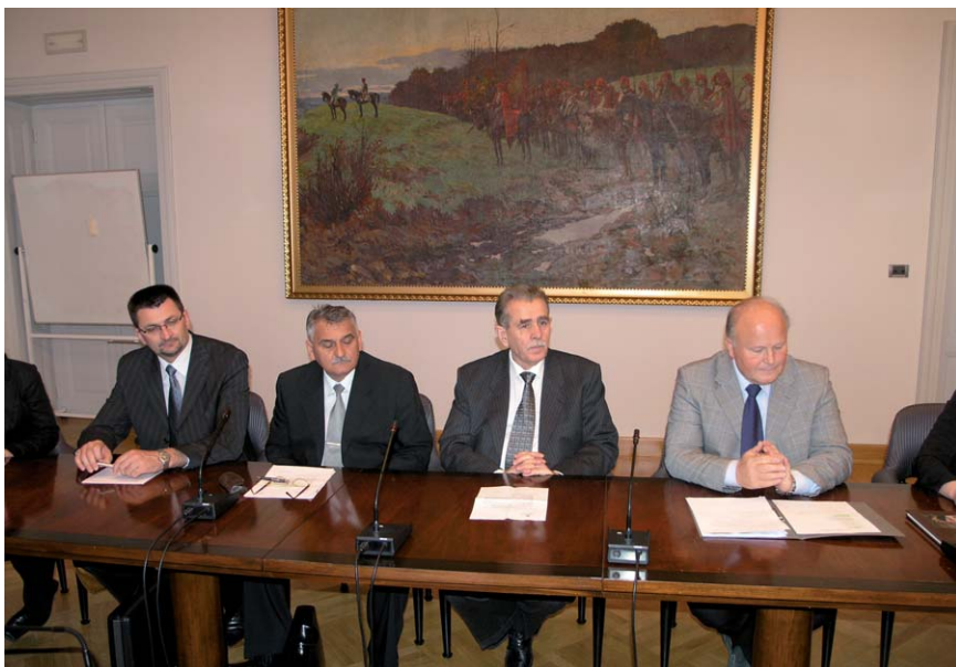
Slavko Linić primio delegaciju njemačkog Saveznog ministarstva okoliša, očuvanja prirode i nuklearne sigurnosti

Tema sastanka bila je unapređivanje parlamentarne suradnje na području zaštite okoliša.