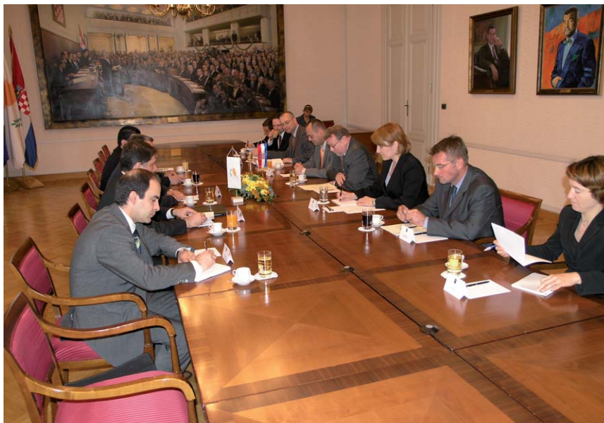
Ciparski ministar vanjskih poslova Yiorgos Lillikas s predsjednikom Šeksom